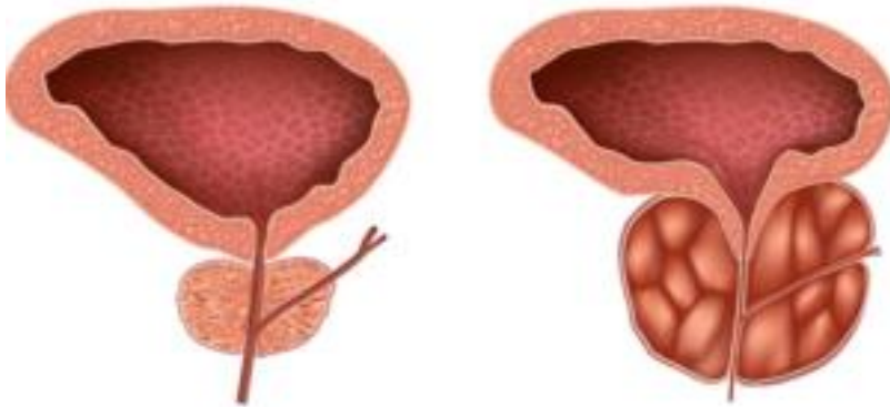
Hypertrophie de Prostate

L'embolisation des artères prostatiques est une technique novatrice non chirurgicale, mini invasive, permettant de traiter les symptômes de l'hypertrophie bénigne de prostate, autrement connu sous le terme d'adénome de prostate.